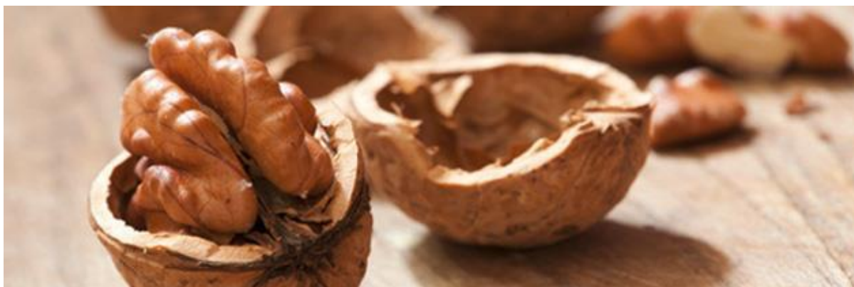
Abbildung: 1: Knacknüsse mit Datenerhebung und -auswertung auflösen

Dagegen können schulintern erhobene Daten wirklich effektiv genutzt werden. Dieser Thematik geht dieser Beitrag nach.